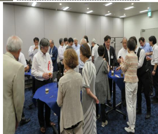
和やかな雰囲気の中 署の方々と懇談する皆様方