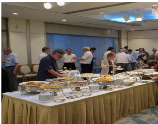
和やかな雰囲気の中 談笑する出席者