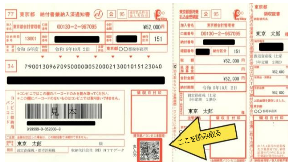
納付書の下部に eL-QR が掲載

地方税お支払サイトの eL-QR 読取画面から納付書のeL-QRを読み取り、支払手続きをすると納付ができます。