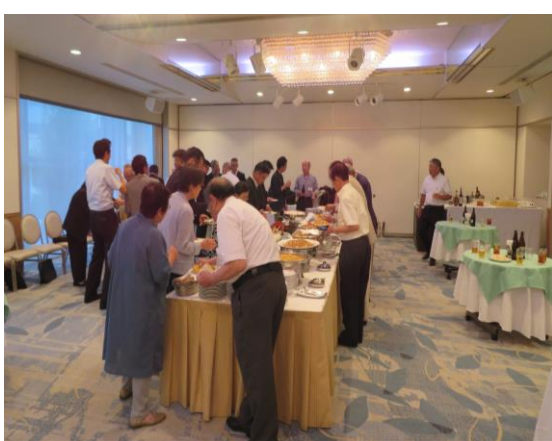
和やかな雰囲気の中 談笑する出席者